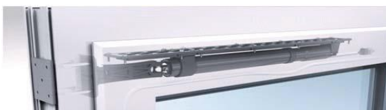
pohon pro otevírání dveří

Možnosti periferií jsou prakticky neomezené, kompatibilitu se zámky je ale potřeba ověřit. Je možné napojení na tzv. Inteligentní dům, případně do systému zabezpečení domu. Dveře lze pomocí periferií nejen odemknout, ale i otevřít a následně zavřít a bezpečně uzamknout.